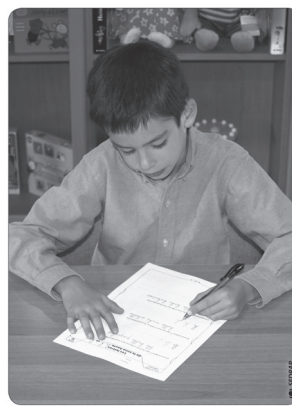
LA TENUE DU CRAYON POUR LES ÉLÈVES GAUCHERS